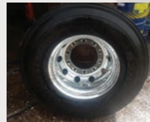
Depois da limpeza